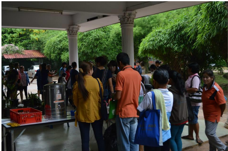
ลงทะเบียน