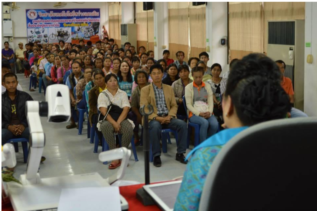
ประธานกล่าวพิธีเปิดงาน