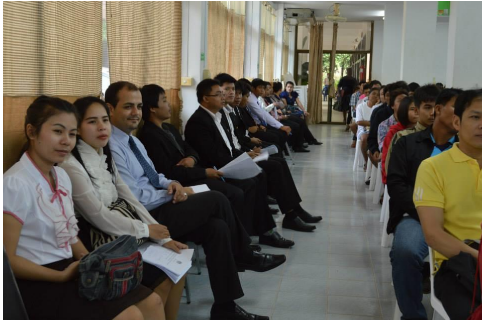
รูปภาพผู้เข้าร่วมโครงการ