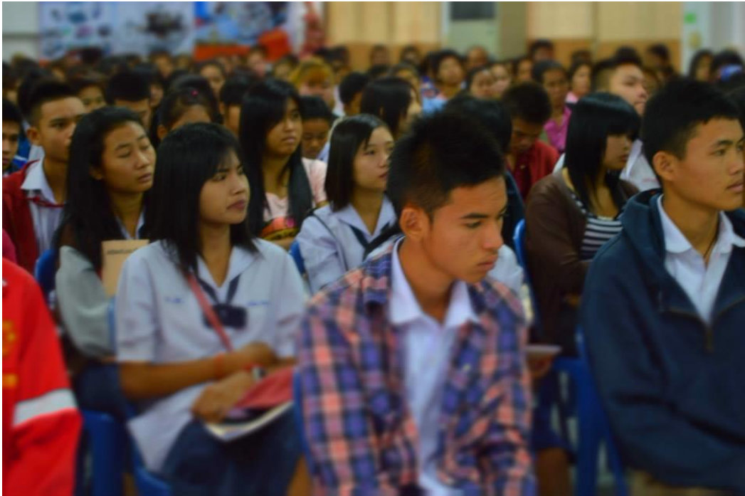
นักเรียน-นักศึกษาและผู้ปกครองเข้าร่วมโครงการ