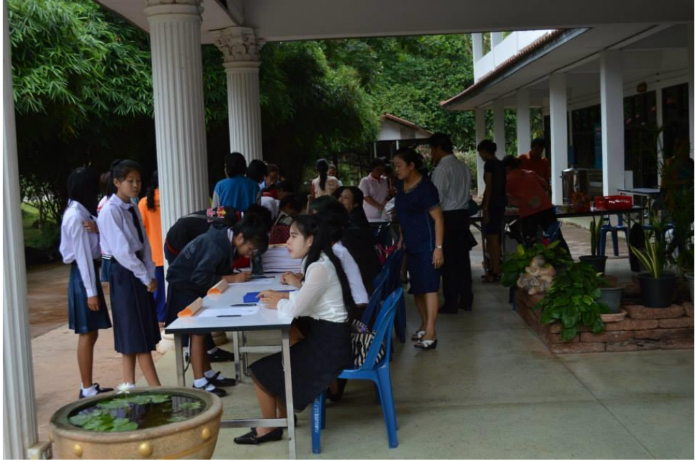
ลงทะเบียน