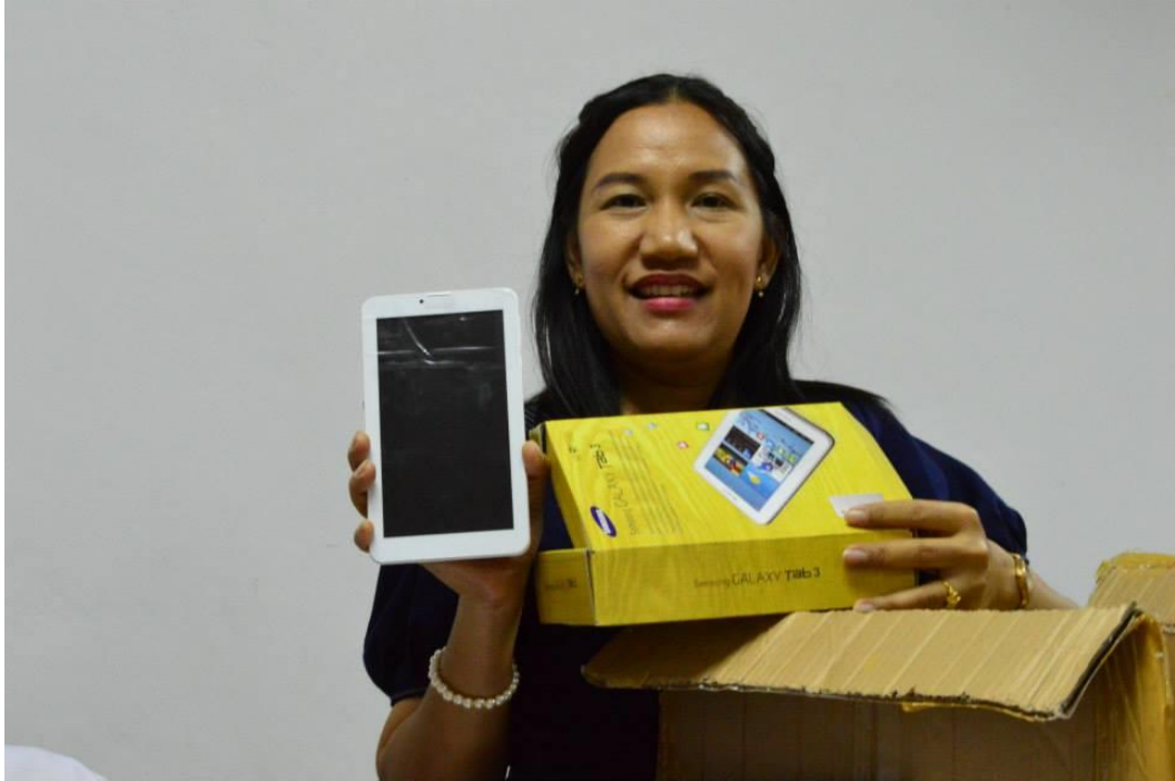
รูปภาพ แท็บเล็ตที่แจกให้นักศึกษา